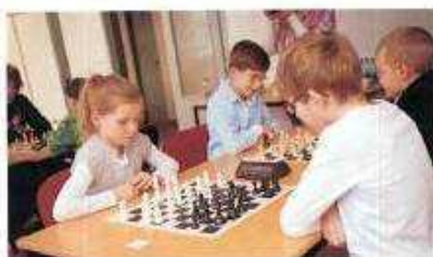
Deti odohrali náročný trojhodinový turnaj systémom každý s každým, tempom 2 x 10 minút.