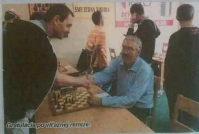
Gratulácia po víťaznej remíze.